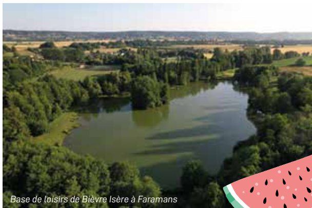
Base de loisirs de Bièvre Isère à Faramans