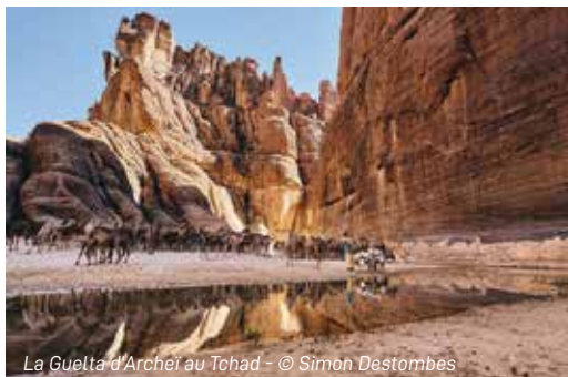
La Guelta d'Archei au Tohad

Des expositions à découvrir pendant les vacances !